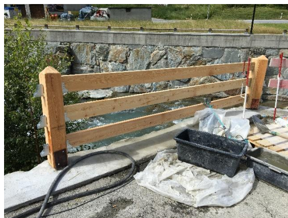
...ergibt ein tolles Endergebnis.

Ein herzliches Dankeschön an alle Beteiligten insbesondere an die Verantwortlichen auf Seite Implenia Schweiz AG. Es ist toll mit euch zusammen zu arbeiten. Ebenfalls ein grosser Dank geht an die Gemeinde Saas-Balen. Schon seit vielen Jahren verstehen sie es Gruppen sinnvoll einzusetzen und begleiten sie dabei vorzüglich. bergversetzer stellt sich für eine weitere Zusammenarbeit sehr gerne zur Verfügung.