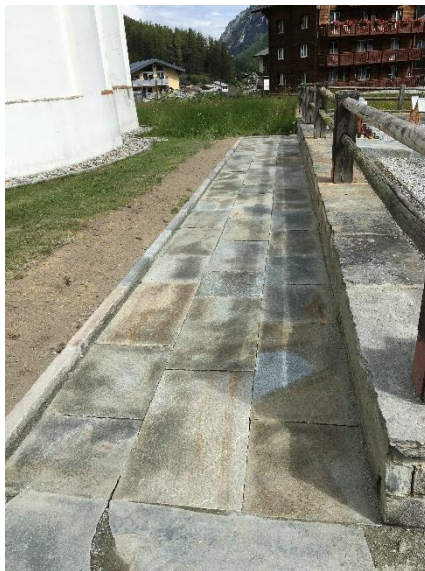
Rollstuhlfähiger Plattenweg bei der Kirche.