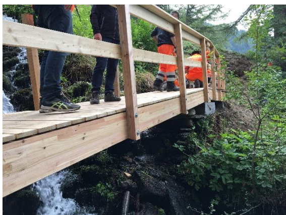
Die neue Holzbrücke über den Bach.