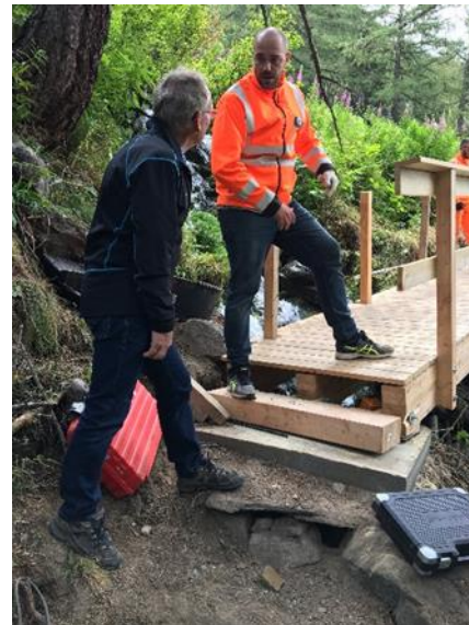
Eine gute AVOR ist die halbe Miete.