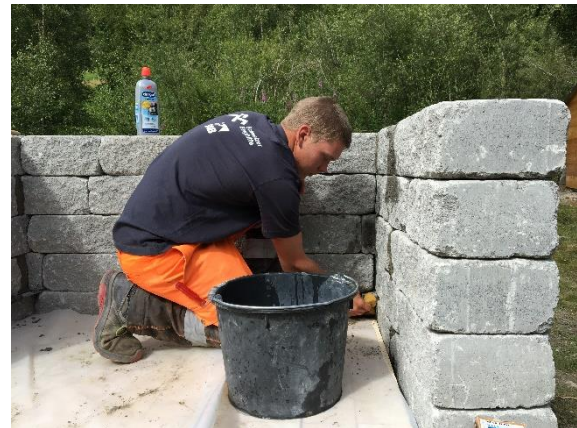
Sauberes Ausfugen ist wichtig.