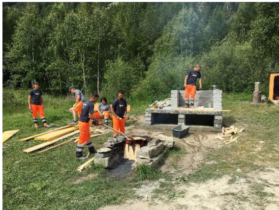
Cheminée-Bau beim Freizeitplatz.