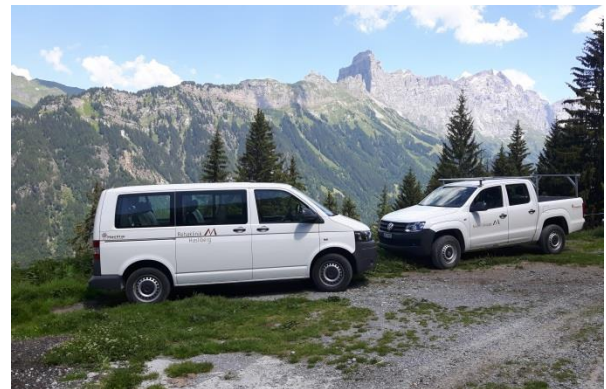
Die Transportfahrzeuge wurden von der Privatklinik Hasliberg zur Verfügung gestellt!