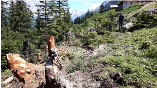
Die Arbeiten im steilen Hang waren herausfordernd.