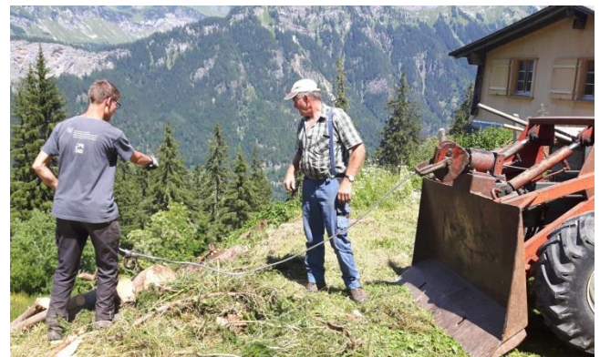
Die gefällten Bäume wurden mit der Seilwinde den steilen Hang hochgezogen.