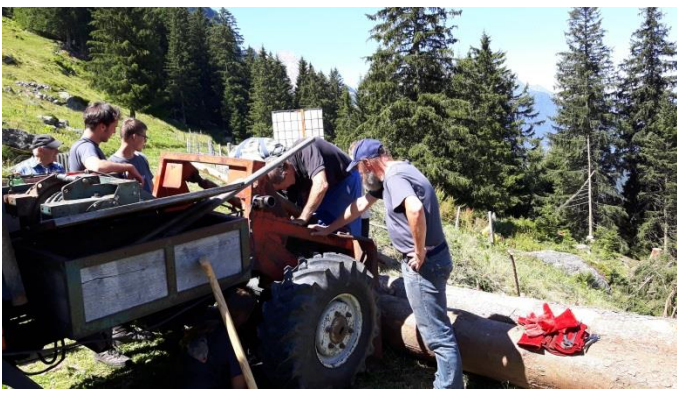
Zwangspause, da die Seilwinde streikte...doch bald ging das Ziehen wieder weiter!