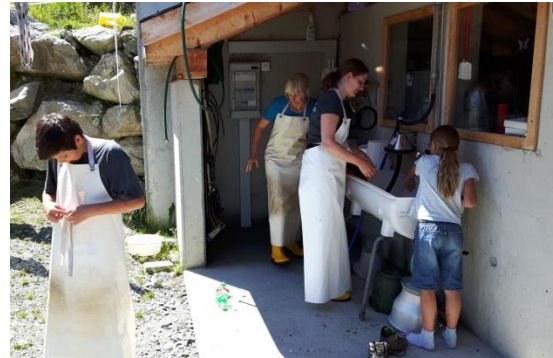
Team Käsepflegen – sie wurden von der Käserin fachmännisch angeleitet.