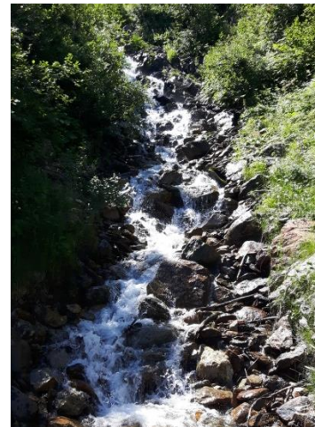
Eindrücke aus der nahen Umgebung der Alp Spycherberg.