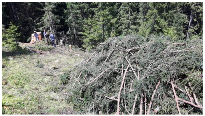
Die Äste wurden zusammengetragen.