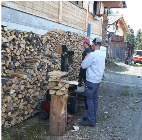
Das gefällte Holz wurde weiter zerkleinert und kommt später als Wärmequelle zum Einsatz.