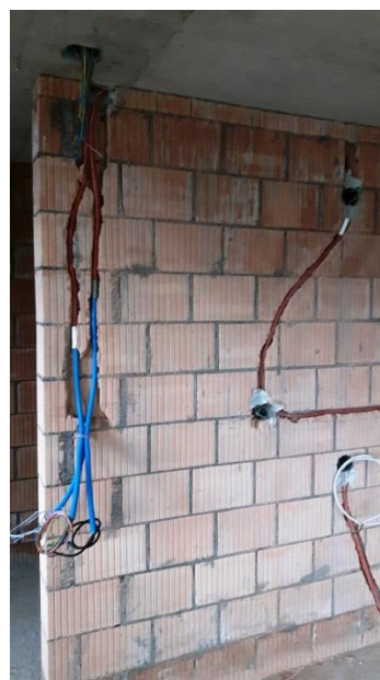
Die Installationen sind weit fortgeschritten