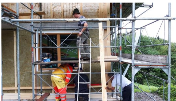
Alle packten mit an!