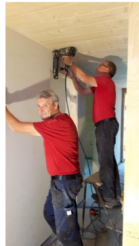
...wurden Fermacellplatten zugeschnitten und befestigt