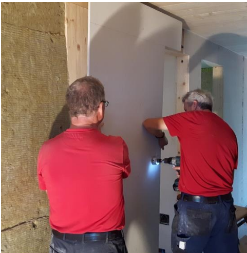
Zuerst wurde die Isolation eingebracht und dann...