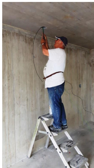
Stromkabel wurden eingezogen