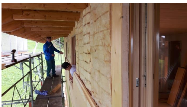
Die Isolation an der Fassade wurde ebenfalls von der Gruppe angebracht