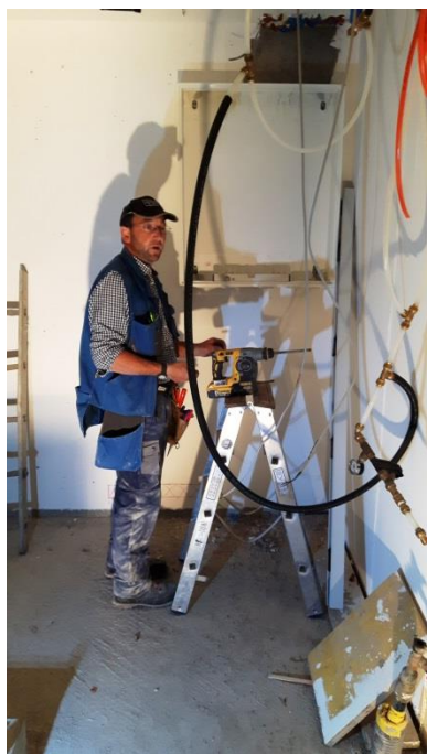
Elektroinstallationen wurden angebracht