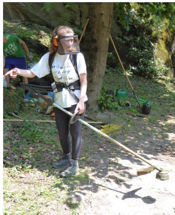
Auch Schülerinnen wussten mit Fadenmäher umzugehen