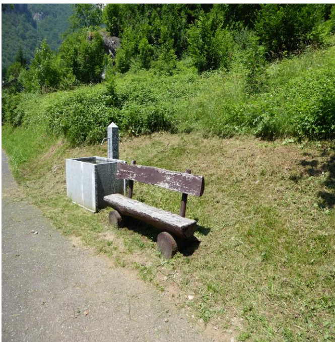
Rastplatz mit Brunnen wurde gesäubert.