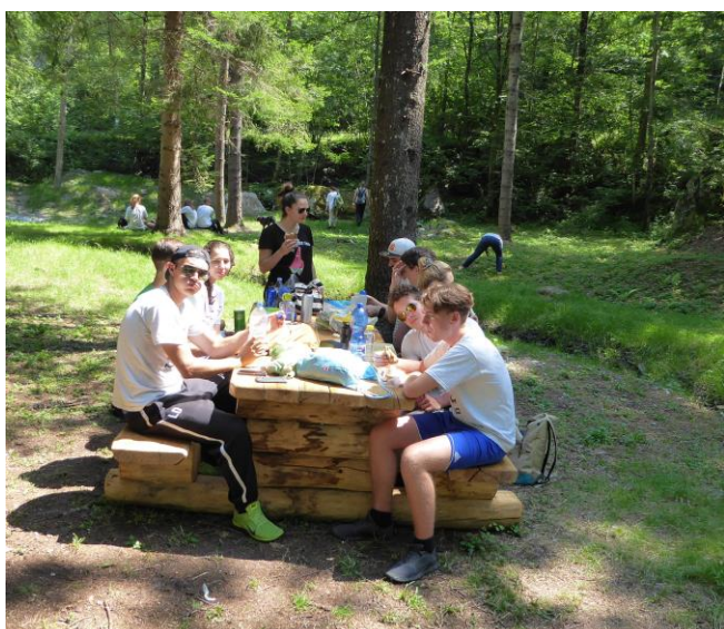
Bei der Mittagsrast