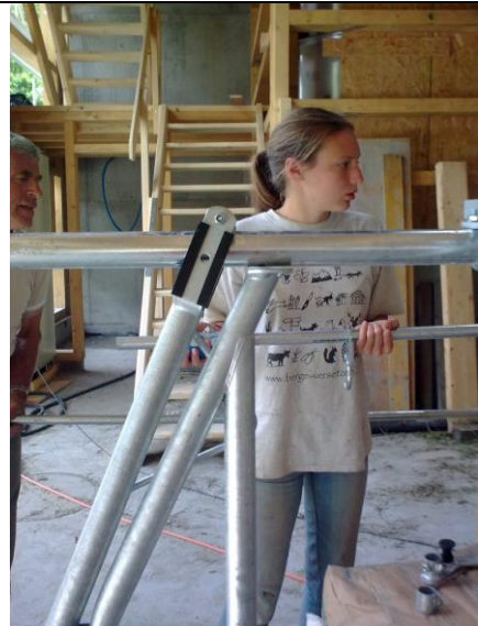
..und die junge Helferin am Element.