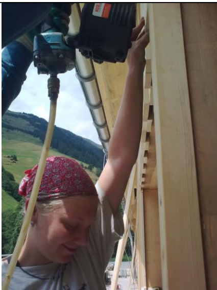
Die Fassadenschalung wird..