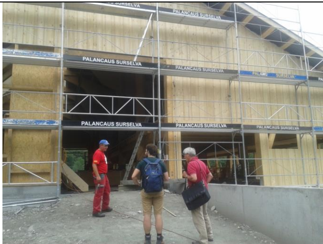
Bauherr empfängt Medien,- und Berghilfebesuch