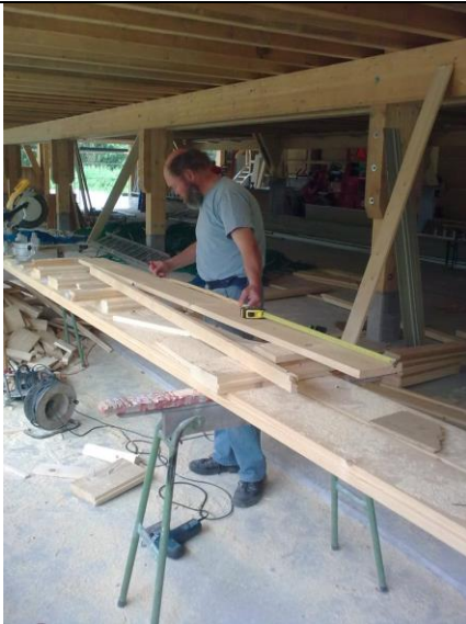
Der Hölzige im Element...