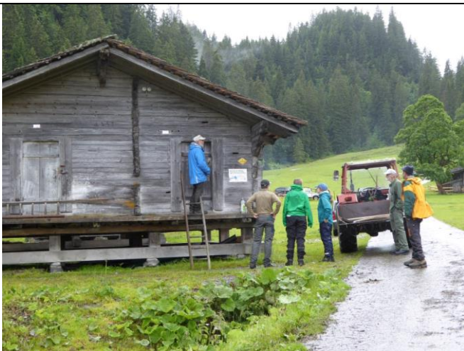
Materialausgabe in der Alphütte Grindel