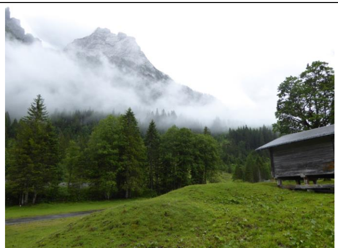
Mit Aussicht auf den Rosenlaugletscher oder das Wetterhorn wir wohl nichts heute