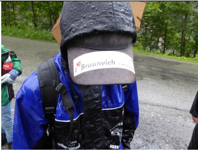
Ein Schüler vom Fach