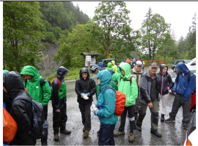
„Helferteilet“ beim Besammlungsplatz