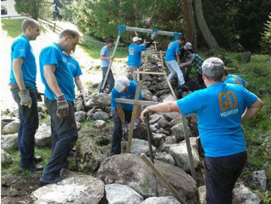
Frauen wie Männer machten sich ans Werke bei Naz.