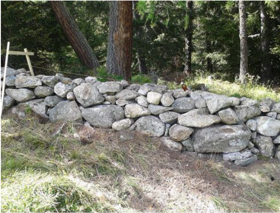
Ein Stück ist fertig und lässt sich sehen