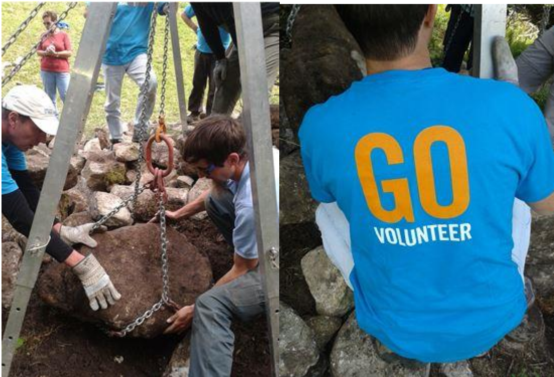
Viele Hände bewirken Gutes